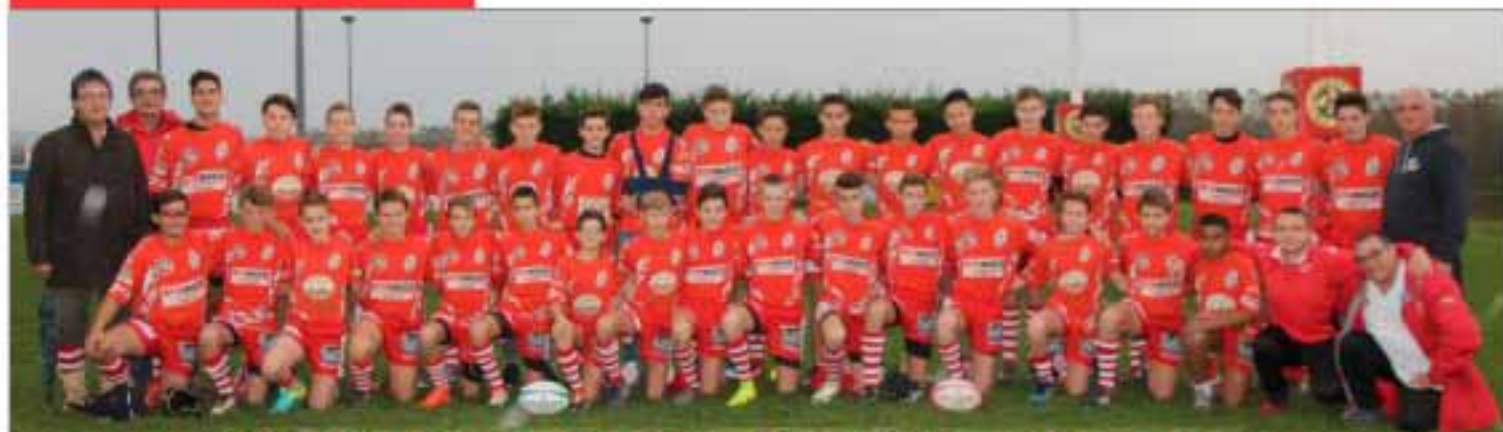
Saison 2016-2017 - Les U16