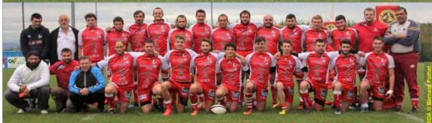
SAISON 2016 / 2017 - l'Excellence B