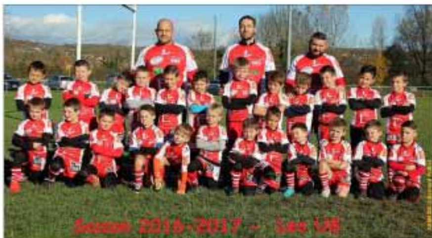
Saison 2016-2017 - Les U9