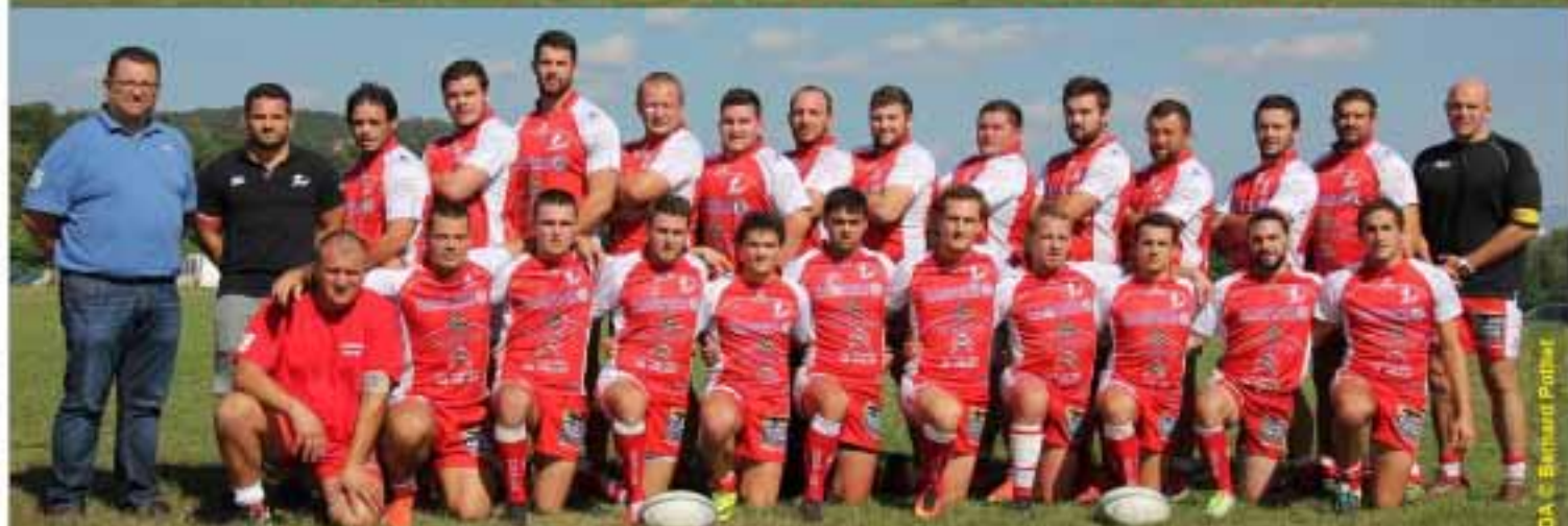
Saison 2016 / 2017 - La Une