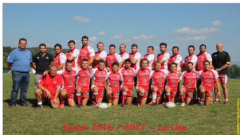
Saison 2016 / 2017 - La Une