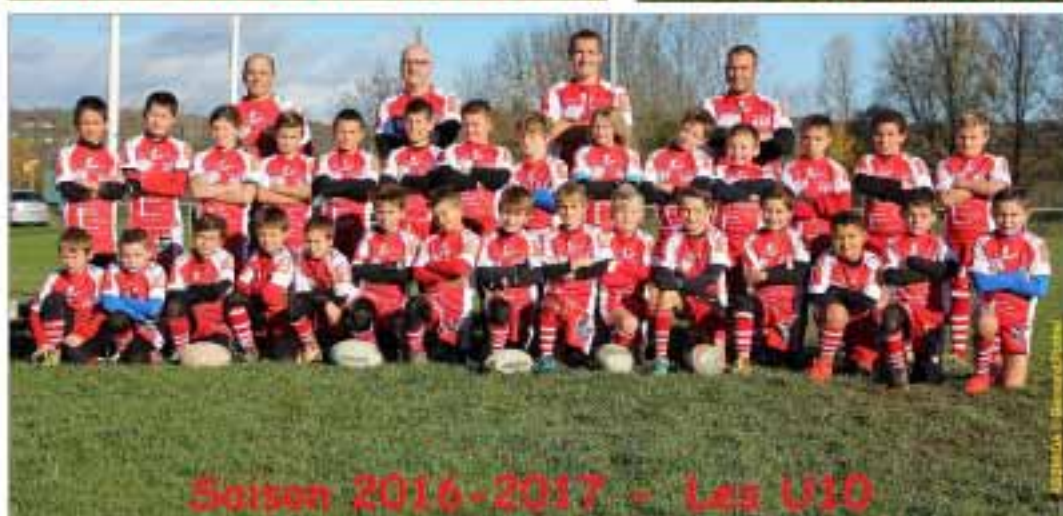
Saison 2016-2017 - Les U10