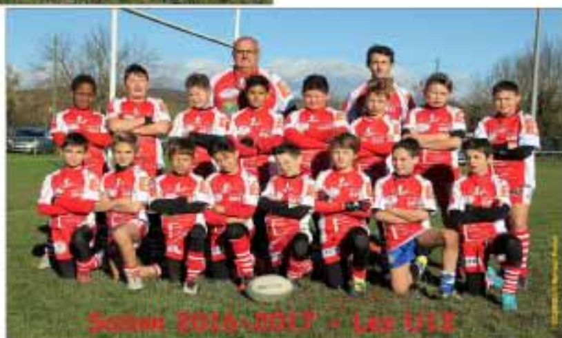
Saison 2016-2017 - Les U12