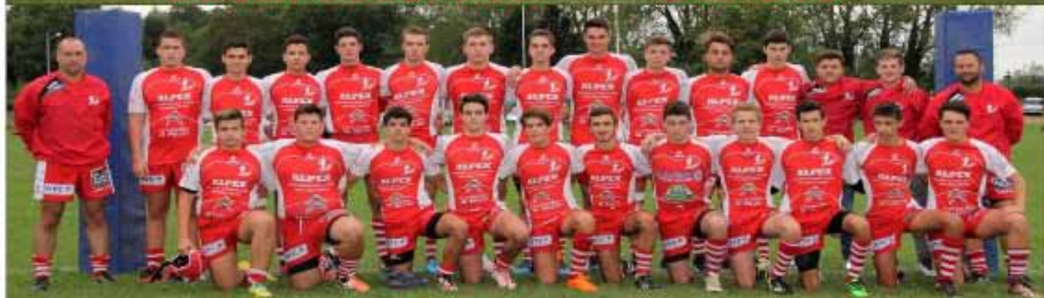
Saison 2016-2017 Les U18