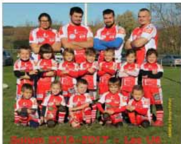
Saison 2016-2017 - Les U8