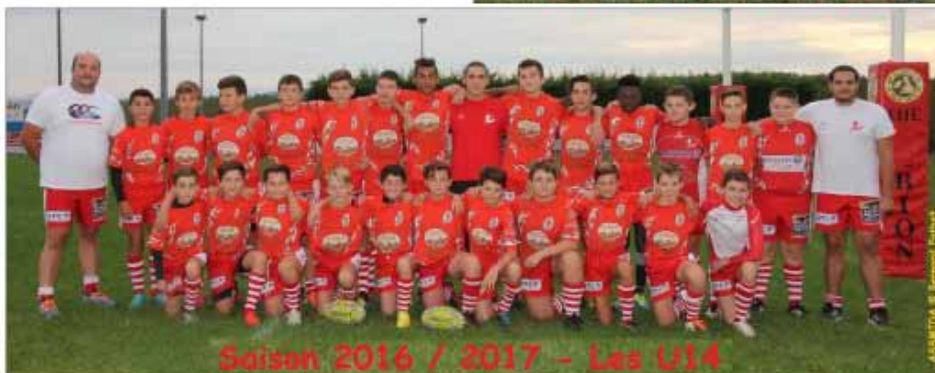
Saison 2016 / 2017 - Les U14