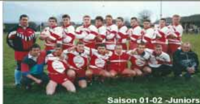
Saison 01-02 -Juniors