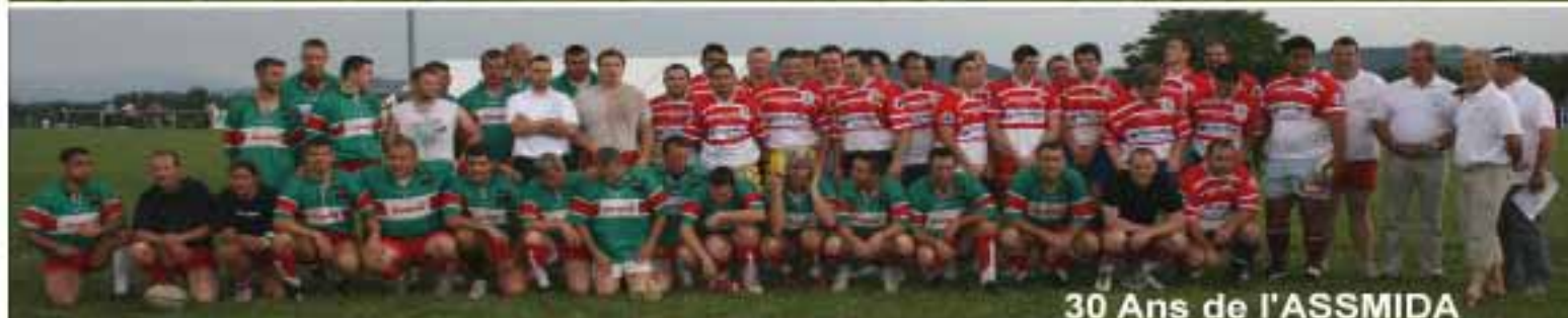
30 Ans de l'ASSMIDA