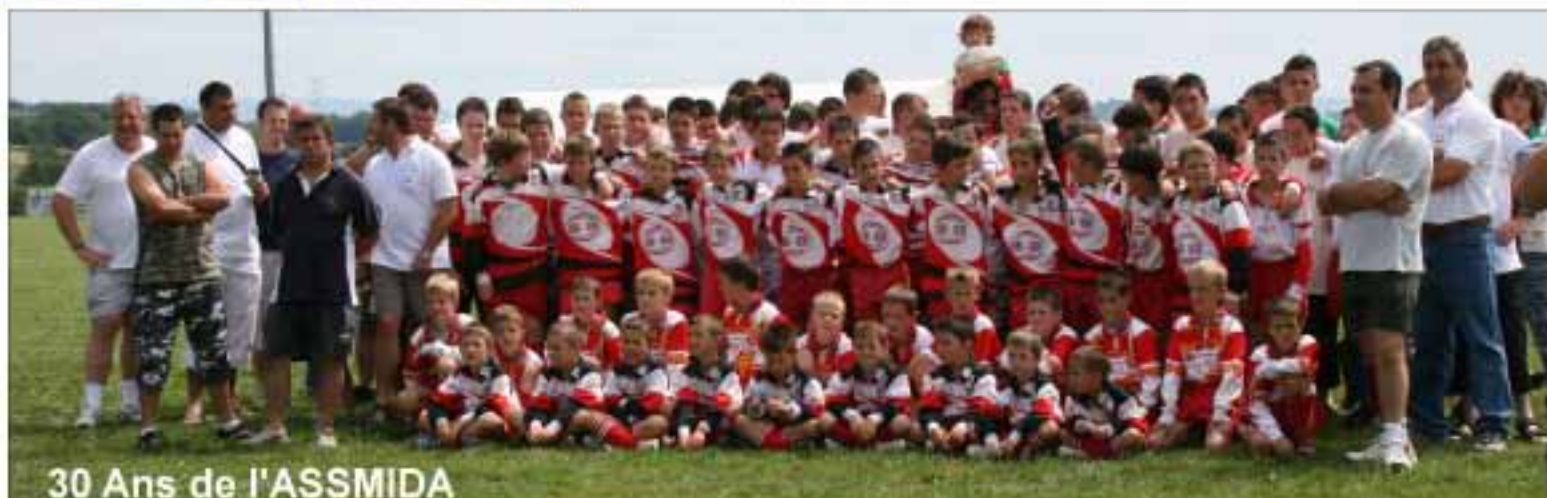
30 Ans de l'ASSMIDA