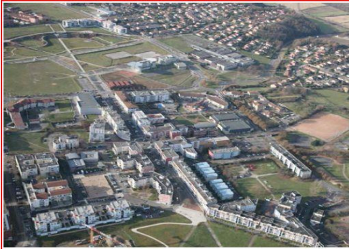
Quartier Saint-Hubert à l'Isle d'Abeau

Il se réunit régulièrement pour recueillir la parole des habitants, formuler des avis sur les projets proposés sur le quartier par les collectivités, aussi faire des propositions de projets aux collectivités pour améliorer la qualité et le cadre de vie des résidents.