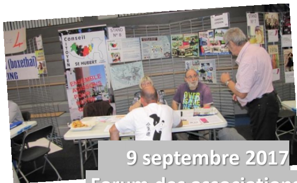
9 septembre 2017 Forum des associations