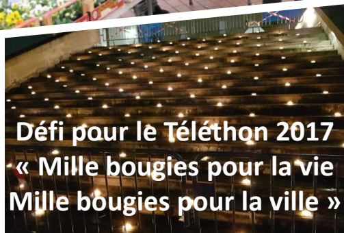
Défi pour le Téléthon 2017 « Mille bougies pour la vie Mille bougies pour la ville »