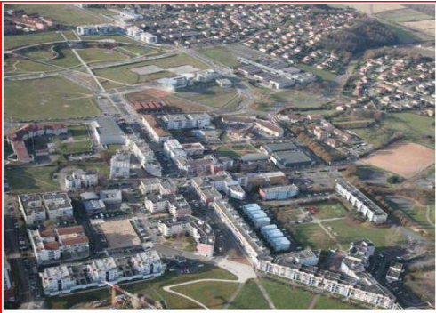
Quartier Saint-Hubert à l'Isle d'Abeau

Il se réunit régulièrement pour recueillir la parole des habitants, formuler des avis sur les projets proposés sur le quartier par les collectivités, aussi faire des propositions de projets aux collectivités pour améliorer la qualité et le cadre de vie des résidents.