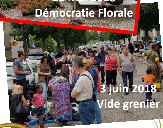
3 juin 2018 Vide grenier