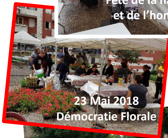
23 Mai 2018 Démocratie Florale