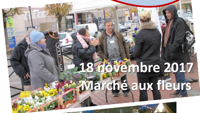
18 novembre 2017 Marché aux fleurs

11 octobre 2017 Inauguration de la Maison du Projet