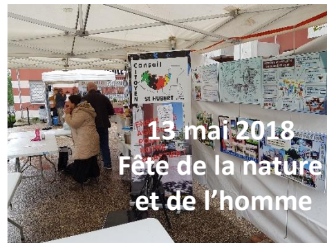
13 mai 2018 Fête de la nature et de l'homme

3 février 2018 Lancement de l'association « L'Isle Entraide »