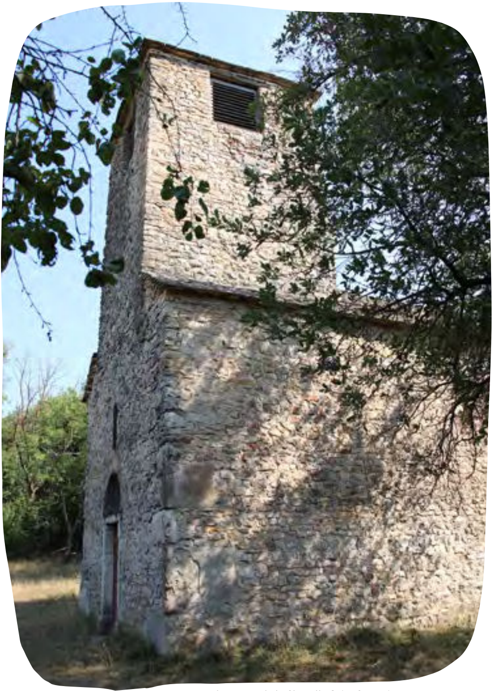
Autre vue de la Chapelle Saint Germain